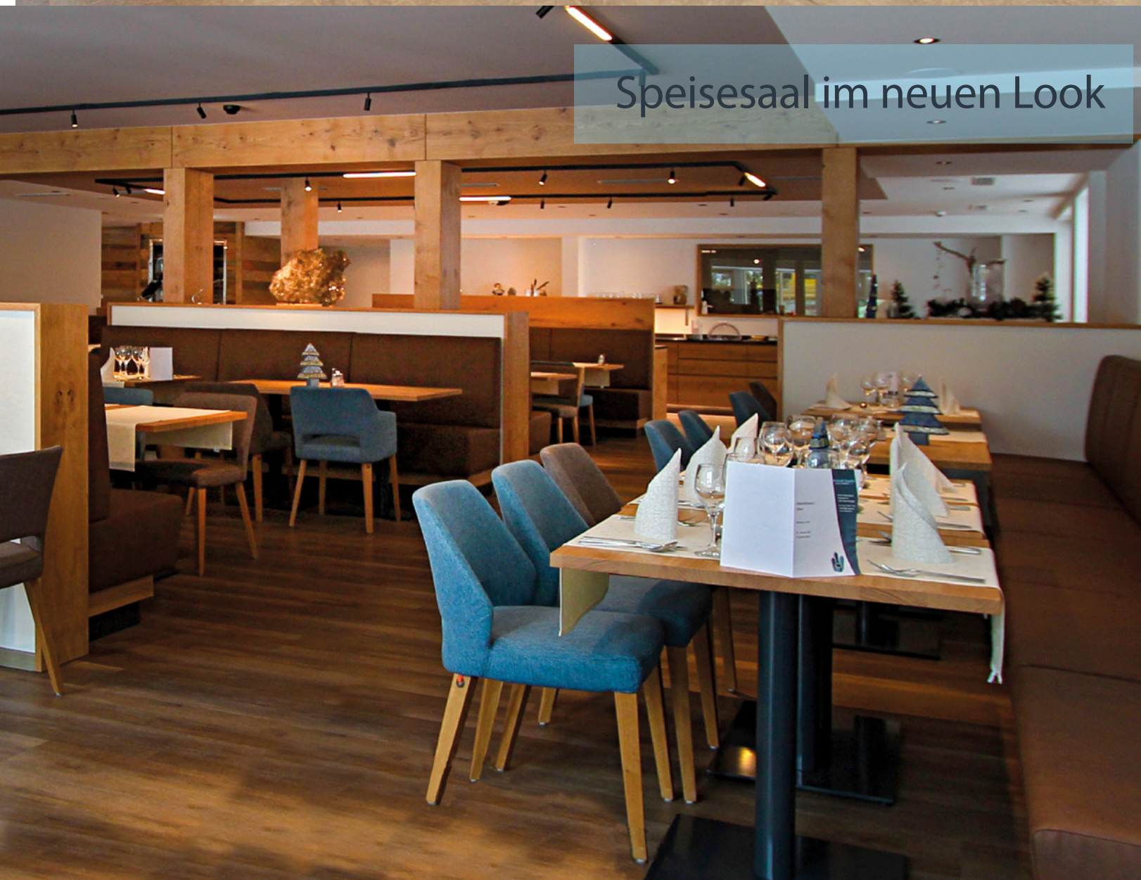
Speisesaal im neuen Look